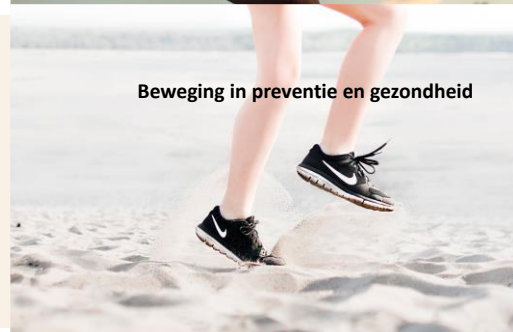
Beweging in preventie en gezondheid