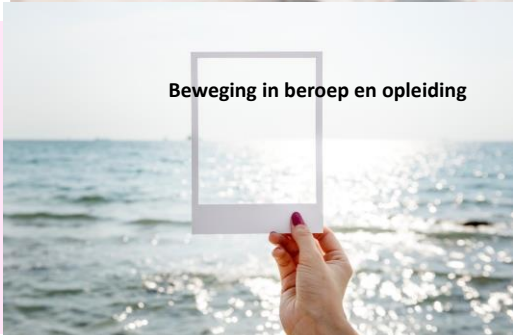
Beweging in beroep en opleiding