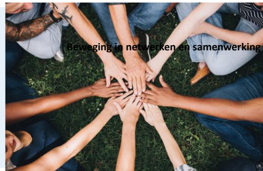
Beweging in netwerken en samenwerking