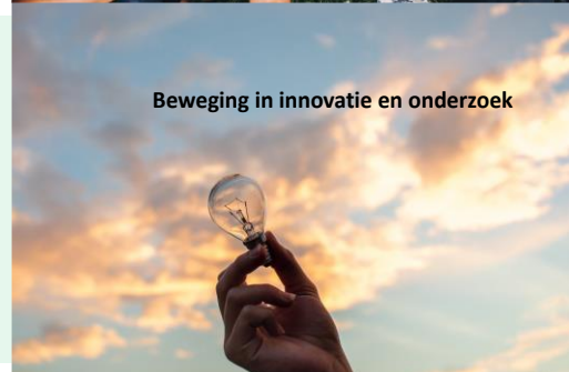
Beweging in innovatie en onderzoek

Ontwikkelen/trainen van trekkers van samenwerking op bestuurlijk niveau